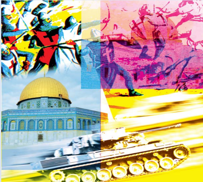
Illustration und Fotomontage: Sabine Herbst, verwendetes Bildmaterial: private Quellen