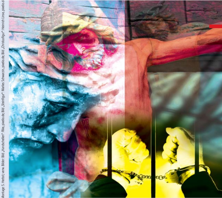
Montage: S. Herbst; new Bilder: Bild „Hirnschellen“; Rue, pueblo.de Bild „Szenfigur“; Marius Schwarz; pueblo.de Bild „Christusfigur“; Heinrich Linca, pueblo.de