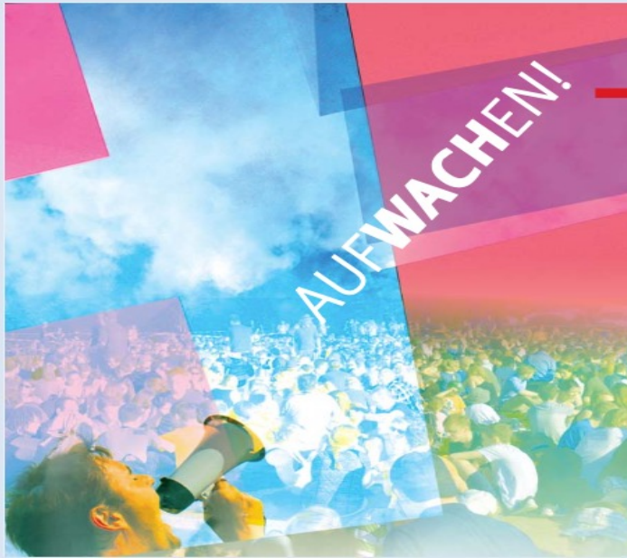
Illustration und Fotomontage: Sabine Hecht, Bad Boll, Mann mit Megaphon; M. E. Juelius de sonogies verwendetes Bildmaterial; private Quellen