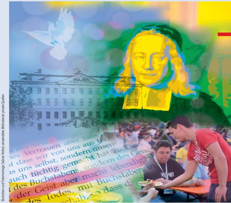
Illustration und Fotomontage: Sabine Herbst, verwendetes Bildmaterial: private Quellen