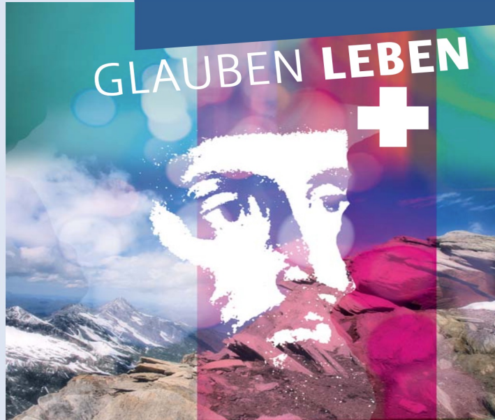
Illustration und Fotomontage: Sabine Heibich, verwendetes Bildmaterial: private Quellen

اجرای الهیات پروتستان در ساختارهای مناطق مختلف مستلزم کار بسیار زیاد و نفوذ در جزئیات بسیاری است. یوهانس بوگنهاگن، که نه تنها دوست و اعتراف کننده لوئر است، احکام کلیسایی قابل کنترلی را برای شهرها و کشورهای متعدد می نویسد.