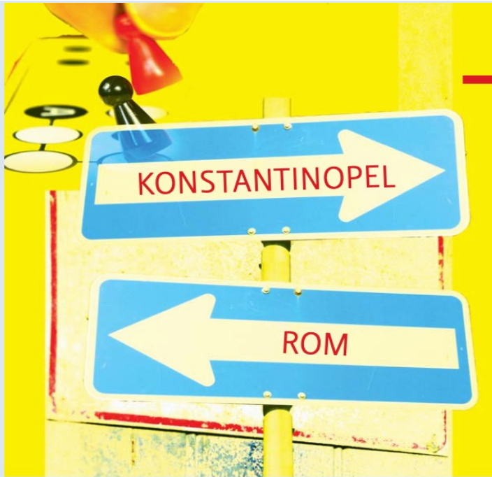
Illustration u. Montage: S. Herbst; verwendete Bilder: Bild „Mensch-ergene-Dob-nicht“: Bernd Kasper, pixelio.de; sonstige: private Quellen