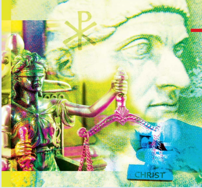
Fotomontage: Sabine Herbig; verwendete Bilder: Bild „Justitia“ - i.vetia, pixelio.de; weiteres Bildmaterial: private Quellen