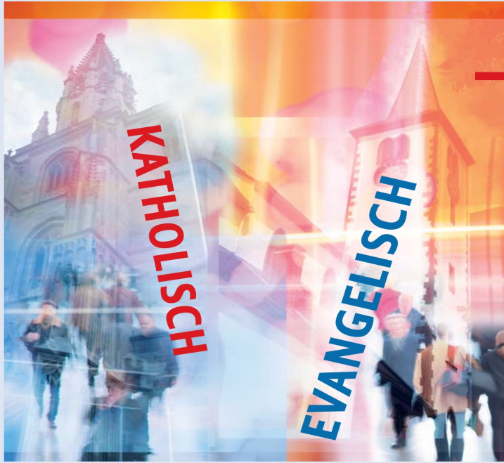
Illustration und Fotomontage: Sabine Herbst, verwendetes Bildmaterial: private Quellen