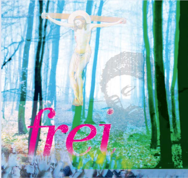
Illustration und Fotomontage: Sabine Herbst; verwendete Bildmaterial: private Quellen