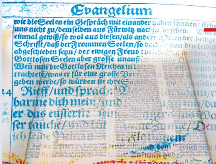
Fotomontage Sabine Heibitz, verwendete Bilder von Dieter Schütz, pixelio.de