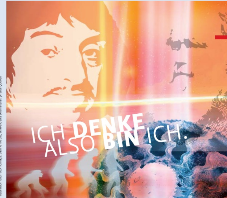
Illustration und Fotomontage: Sabine Hebbt, verwendete Bildmaterial: private Quellen

تحت رهبری پاپ پیوس نهم. کلیسای کاتولیک مسیری ضد لیبرالی و ضد مدرنیستی را در پیش گرفته است. نتیجه اصلی محکومیت ۸۰ خطای مدرنیته