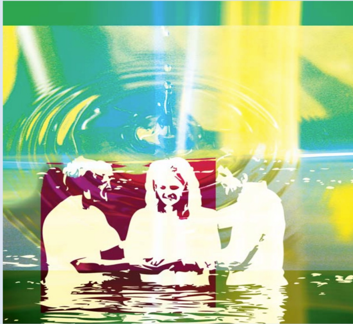
Illustration und Fotomontage: Sabine Herbst; verwendete Bildmaterial: private Quellen

به بازدید و تقویت حلقه‌های پراکنده آناباپتیست و دادن جهت مثبت به آنها گذراند. پس از مرگ مننو سامون، پیروان او را "منونیت" می‌نامند.