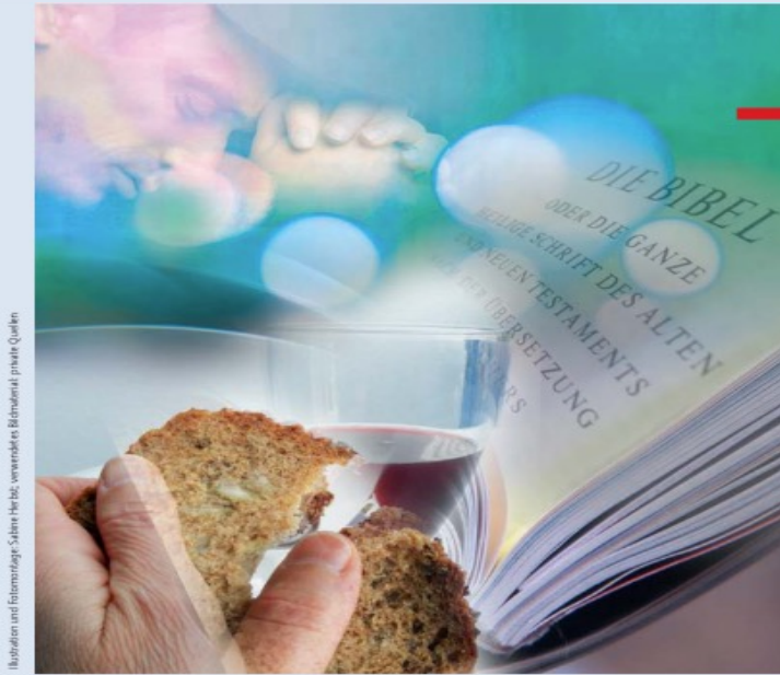
Illustration und Fotomontage: Sabine Heitz, verwendetes Bildmaterial: private Quellen