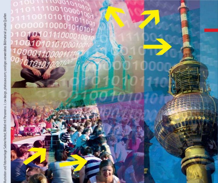
Illustration und Fotomontage: Sabine Heusch, Bildteil mit Perserino. L: cow-design, photocase.com; sonstige verwendete Bildmaterial: privat-Quellen