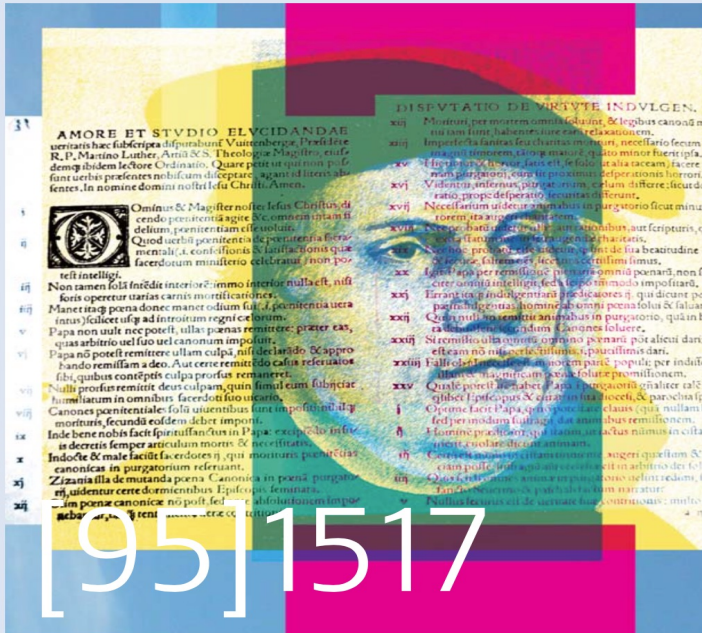
Illustration und Fotomontage: Sabine Herbst, verwendetes Bildmaterial: private Quellen

لوتر از طرف صومعه خود برای ادامه تحصیل و سخنرانی به ویتمبرگ فرستاده شد. با وجود شناخت آکادمیک، لوتر هنوز به آرامش درونی نرسیده بود. مسئله نجات و یقین در نجات همچنان او را به خود مشغول کرده بود. هنگامی که در سال ۱۵۱۰ طبق حکمی به رم فرستاده شد، به کمکی درونی امیدوار بود. از طرفی دیگر سطحی نگرانی، تجمل و طمع کلیسا او را در پریشانی بزرگتری فرو می‌برد. در طی آماده سازی برای اولین سخنرانی خود به عنوان استاد تازه فارغ التحصیل، او متوجه می‌شود که عدالت خدا، که در رومیان ۱-۱۷ از آن صحبت شده است، لزومی ندارد که ما انسان‌ها برای بدست آوردن آن کاری را انجام دهیم، بلکه این فقط از طریق فیض می‌تواند به ما داده شود. لوتر بیش جدید خود را در چهار اصل زیر فرموله کرد: sola gratia فقط لطف - sola fide فقط باور - sola scriptura فقط کتاب مقدس - solus Christ فقط مسیح.